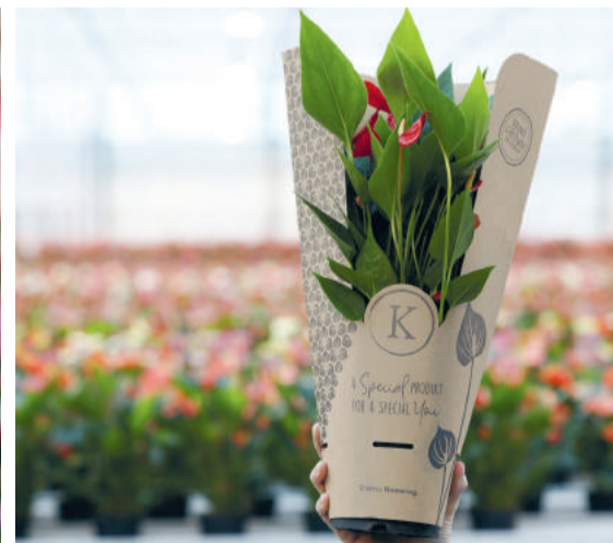
De door Lydia Langelaan ontworpen kartonnen gift bag.