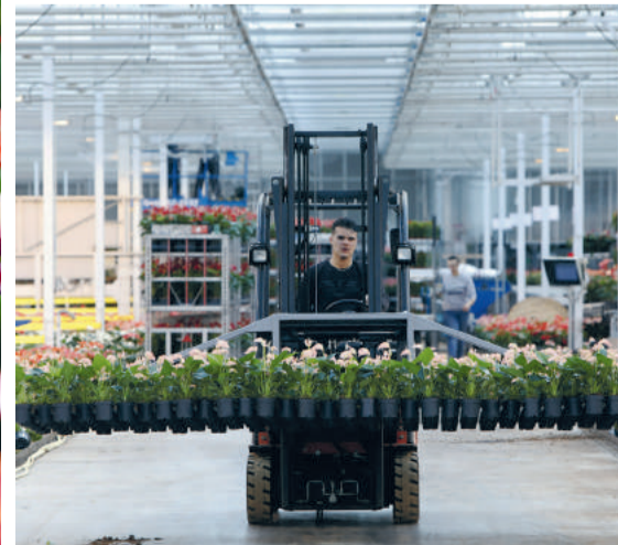
De productielocaties zijn in hoge mate geautomatiseerd.